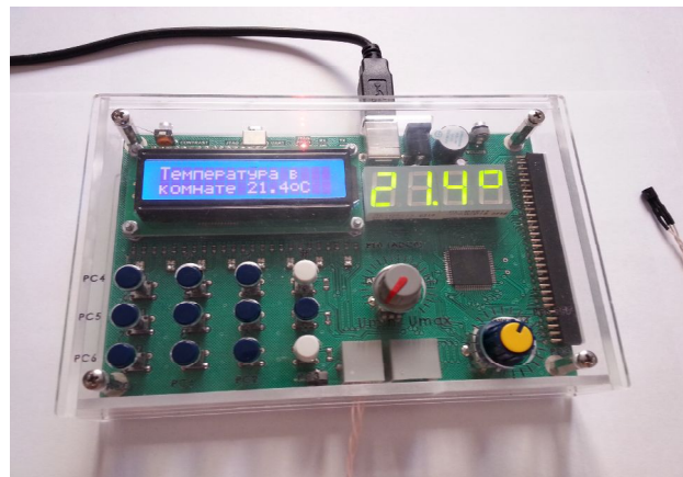
Рис. 2. Общий вид макета

В программе реализован опрос датчика температуры 1 раз в секунду. Результаты измерения в виде цифровых значений выводятся на семи сегментный индикатор, а жидкокристаллический дисплей отображает текстовую часть сообщения и дублирует цифровую. При превышении значения температуры выше установленной нормы включается звуковая и световая сигнализация. На рис. 2 показан общий вид макета с результатами измерения.